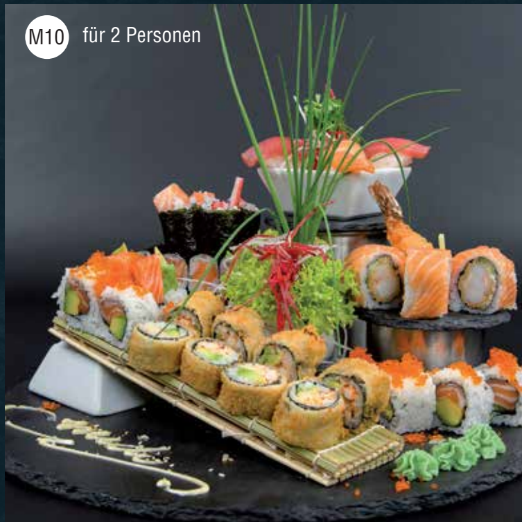
M10 für 2 Personen